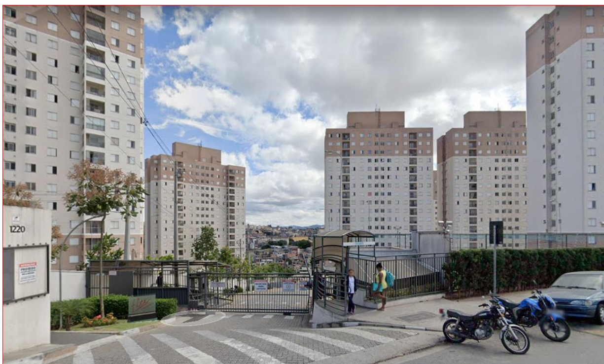
Imagem: 02 – FACHADA